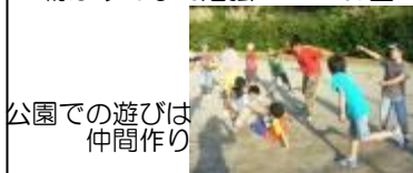
公園での遊びは仲間作り