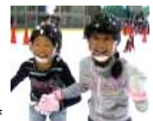
みんなで スケートや動物園へおでかけ↑ 高学年は自主企画おでかけ→