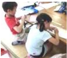
朝はみんなで勉強

一緒に生活する時間が長い分、つながりを結んでいくきっかけやチャンスが盛りだくさん。年上と。年下と。大人と。生活の中での体験と経験を積み重ね一歩先の自分へ。夢中になって時間と心を費やせる取り組みを通して、それぞれの絆を作り、仲間で作り上げていく40日です。