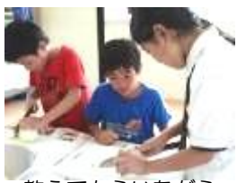
教えてもらいながらお昼ごはん作り