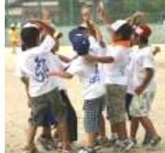
仲間と目指す大きな夢 キックベース大会連覇に向けて