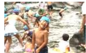
みんなでキャンプ